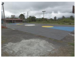
Cancha de juego