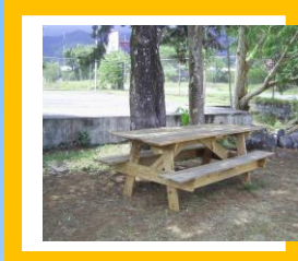
Cancha de juego