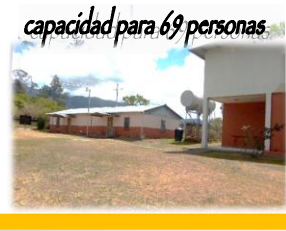
capacidad para 69 personas