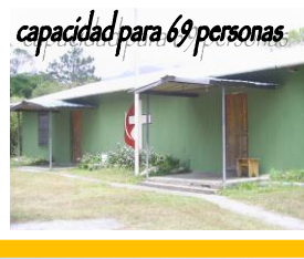
capacidad para 69 personas