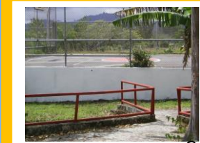
Cancha de juego